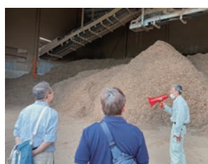
木材を製紙用チップへ再生