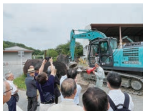
ブロックと鉄筋の分別

搬入された産廃を粉砕等して資源別に分別・処理し、リサイクル資源へと生まれ変わらせる職場の現場を見学させていただき、また、建屋の一部の柱や貯水タンクなども取り壊して不要となった資材を再活用していることも説明され、地球環境にやさしい事業を営む職場を訪問させていただきました。