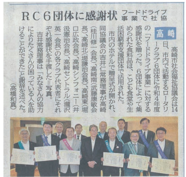
2023. 6. 15 上毛新聞掲載