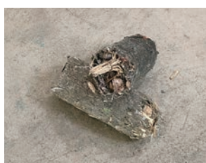
プラスチックから固形燃料へ再生